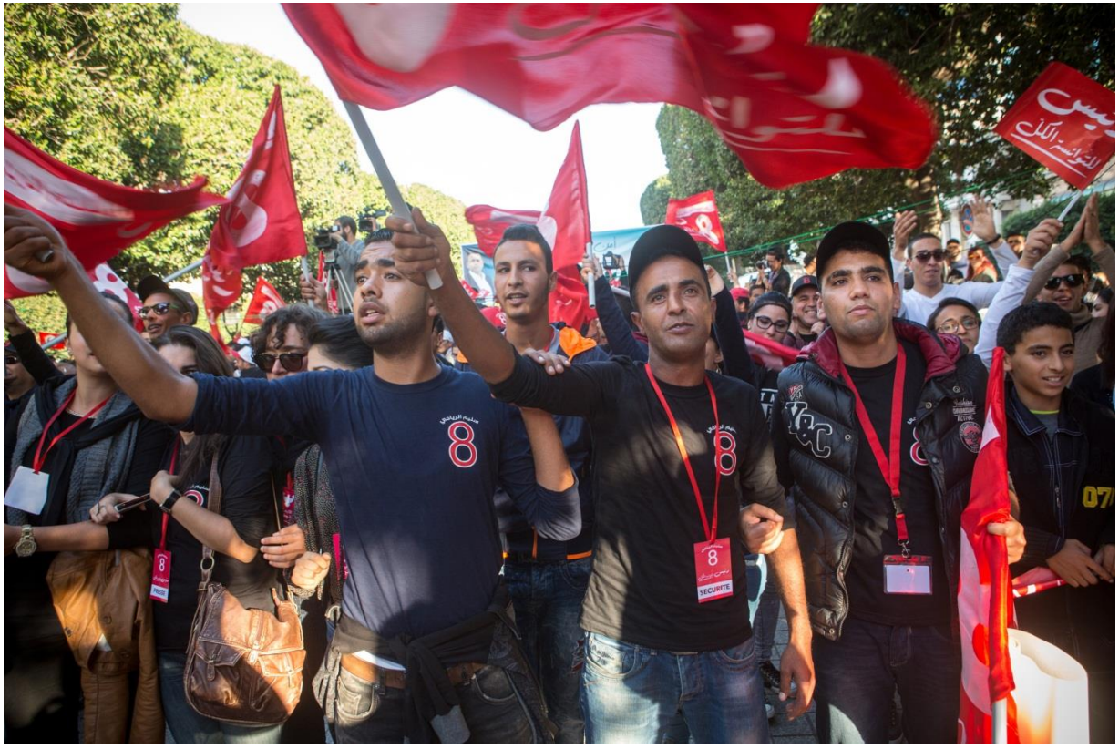
مؤيدو المرشح الرئاسي سليم الرياحي يلوحون بالرايات في تأييد لحزب الاتحاد الوطني الحر خلال اجتماع سياسي في شوارع تونس

الواقع المحلي، مما أعطى السباق نكهة محلية. و اتجهت معظم البرامج الانتخابية إلى نفس القضايا مثل : استعادة سلطة الدولة، والحاجة لخطّة تنمية شاملة لاستهداف البطالة، و وضع استراتيجية شاملة لمكافحة الإرهاب. أما في الجنوب، فكان لبعض العوامل الأخرى مثل الانتماء الأيديولوجي و الروابط العائلية / القبلية دور هام في تعبئة الناخبين.