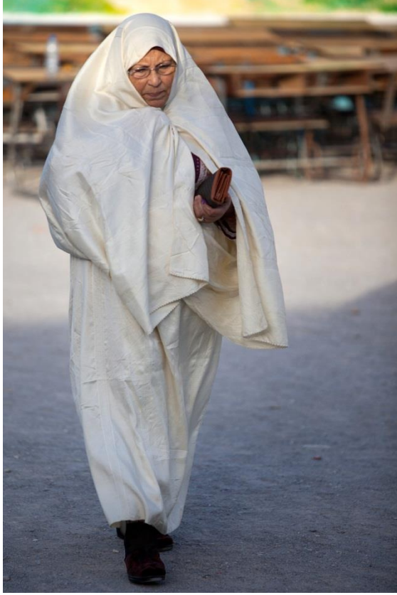
امرأة تغادر بعد التصويت بمركز اقتراع بمدرسة ابتدائية بقرمبالية في سليمان، نابل في شمال شرق تونس

قبل الموعد الدوري للانتخابات التشريعية" كما يكون " توزيع المقاعد في مستوى الدوائر على أساس التمثيل النسبي