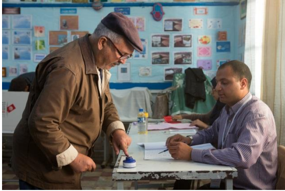
يساعد موظف الهيئة العليا المستقلة للإنتخابات الناخبين في يوم الاقتراع خلال الدورة الأولى من الانتخابات الرئاسية

بتحديد مكاتب الاقتراع المخصصة لهم بسرعة من خلال رسالة نصية صادرة عن الهيئة ساعدهم على التوجه المباشر للمراكز و قلّص من الارتباك المرتبط بالعملية. غير أنّ تنظيم قوائم الناخبين باعتماد أرقام بطاقات التعريف الوطنية، التي ترتبط بالسن أدى إلى تركيز الناخبين من كبار السن في بعض مكاتب الاقتراع والناخبين الأصغر سنا في مراكز أخرى. و لهذا الغرض، يوصي المركز بأن يتمّ خلال الإنتخابات المقبلة تنظيم قوائم الناخبين داخل مراكز الاقتراع بشكل عشوائي و ذلك لتجنب الطوابير الطويلة و التقليل من فترات انتظار الناخبين في مراكز الإقتراع المخصصة لهم.