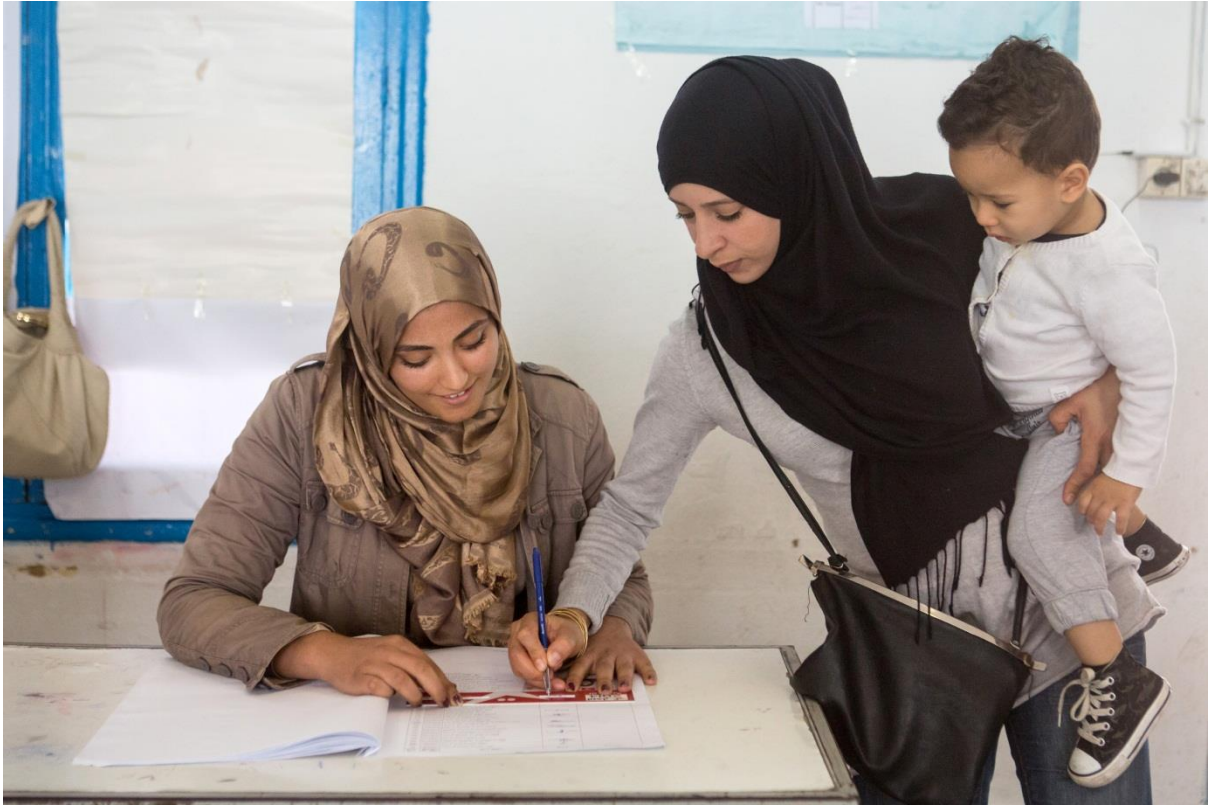
امراة تونسية توقع على السجل الإنتخابي قبل التصويت. تم تعيين مراكز الاقتراع. خصص لكل مكتب إقتراع حتى 600 ناخب الذين تحققوا من تسجيلهم في المكاتب بإظهار الهوية و التوقيع على قائمة الناخبين

منها لما جاء في القانون. و لاحظ مركز كارتر أن هذا القانون و إن كان يدعو إلى مجرّد نشر قوائم الناخبين ليطلع عليها المواطنون، فإنّه لم يطبّق بشكل موحد في جميع المناطق. فإن كانت هذه القوائم قد نشرت بشكل علني أحيانا، فإنّها لم تكن متاحة في أحيان أخرى بشكل يسهل معه الإطلاع عليها 55 . و قد كان هناك نقص ملحوظ في المواد التعليمية الخاصة بتوعية الناخبين حول كيفية وسبب إعادة النظر في القوائم. و تم تقديم ما مجموعه 87 اعتراضا حول تسجيل الناخبين من قبل