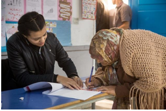
إمرأة تونسية توقع بالسجل الإنتخابي قبل بدء التصويت في تونس يوم 23 نوفمبر 2014

نظاما انتخابيا معيناً لتحقيق هذا الغرض. 22 و عموماً، فإنّ النظام الانتخابي التونسي يحترم إجمالاً مبدأ الاقتراع العام، على الرغم من التناقضات التي وقع توضيحها في القسم السابق و التي سلطت الضوء على الفشل في الضمان التام لمبدأ الاقتراع على قدم المساواة من حيث صلته بالتمثيل البرلماني.