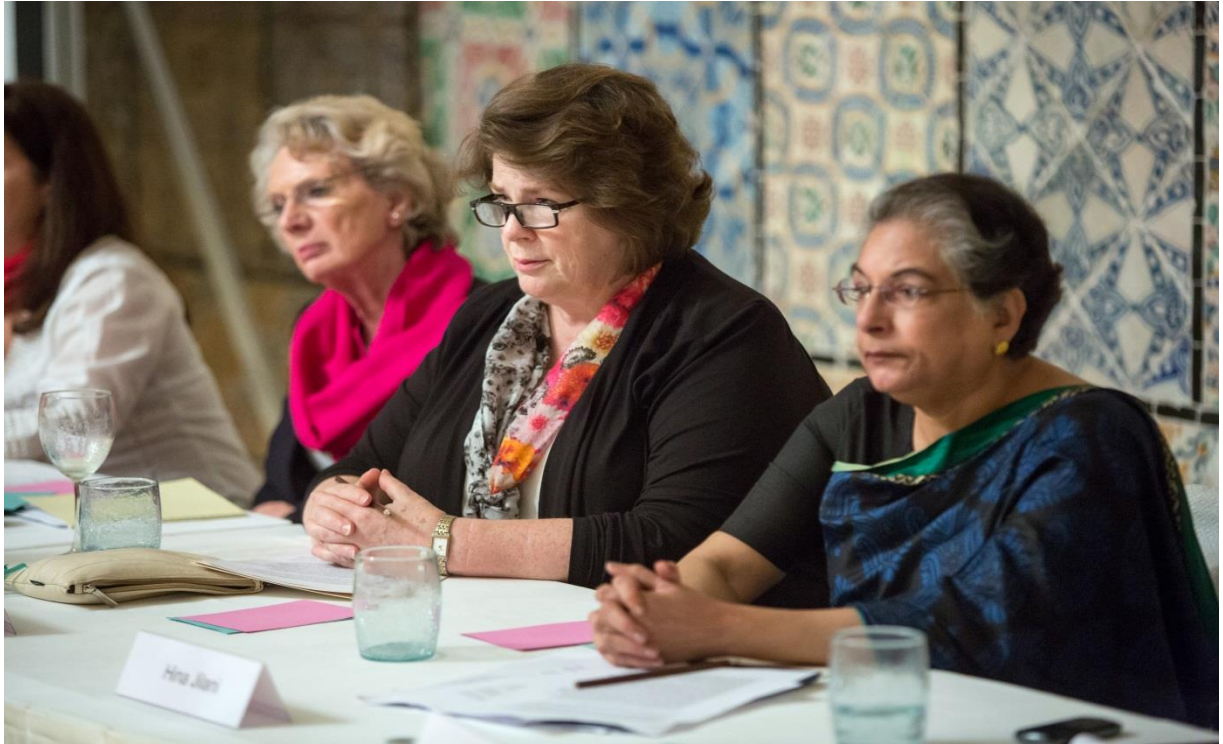
السفيرة أودري غلوفر (يسار) و السفيرة ماري آن بيترز الرئيس التنفيذي لمركز كارتر (وسط) قادة بعثة مراقبة الانتخابات بتونس. إلى جانب هينا جيلاني المحامية الدولية و الناشطة الحقوقية (يمين)، حضرن إجتماعا في نهاية البعثة مع ملاحظي المركز و موظفيه.

و اعتبر ملاحظو مركز كارتر في 99 في المائة من الملاحظات التي أوردوها لتقييم التنفيذ الشامل للإجراءات بأنّ مستوى هذه العملية كان "جيد جدا" أو "معقولا". و أضافوا أنّ إجراءات الاقتراع قد تمّ احترامها، رغم بعض الإستثناءات البسيطة. و تعتبر هذه المخالفات معزولة و هي تشمل بعض الحالات التي لم تكن فيها التعليمات المقدّمة للناخبين حول كيفية التصويت كافية، أو عدم قيام الموظفين بالتأكد من خلو أصابع الناخبين من الحبر، أو عدم طلاء أصابعهم بالحبر كما تنص على