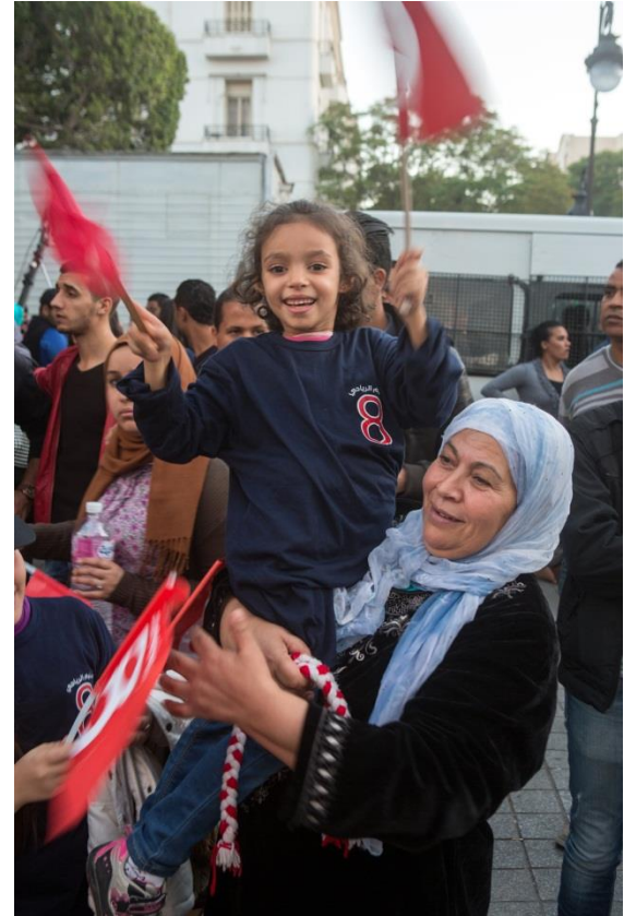
في كل من الدورات الثلاث من الانتخابات، بدأت نشاطات الحملات الانتخابية بوتيرة بطيئة ولكنها تكثفت مع اقتراب نهاية فترة الحملة الانتخابية.

في كل دائرة انتخابية للانتخابات التشريعية. و قدمت إلى الهيئات الفرعية أكثر من 1500 قائمة لمرشحين، تمت الموافقة على 1327 منها بما مجموعه أكثر من 9500 مرشح. و قدمت الأحزاب 61 في المائة من القوائم. و تتوزع البقية بين قوائم مستقلة (26 في المئة) وقوائم لتحالفات (13 في المئة). ورفضت الهيئة بعض قوائم المرشحين، حيث فشل المتقدمون في تلبية متطلبات الأهلية المختلفة، بما في ذلك على سبيل المثال : عدم التسجيل خلال المرحلة الأولى من عملية تسجيل الناخبين، وعدم المساواة بين الجنسين في القوائم التكميلية، والفشل في تقديم عدد كاف من المرشحين المعوضين، و عدم تقديم البيانات الضريبية، وعدم وجود توقيع المرشح أو التوقعات معرفة الإضاء.