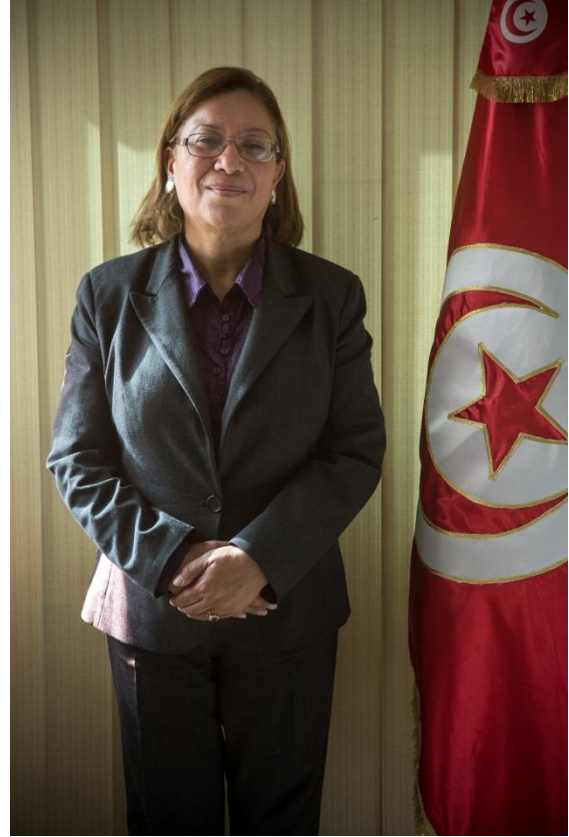
المرشحة للانتخابات الرئاسية كلثوم كنو في مكتبها في تونس يوم 22 نوفمبر 2014

وتعهدت حكومة العريض باجراء الانتخابات بحلول نهاية سنة 2013، إلا أن الواقع السياسي والأمني صعّب هذه المهمة. وكان اغتيال بلعيد قد أعطى طابعا ملحا لمهمة