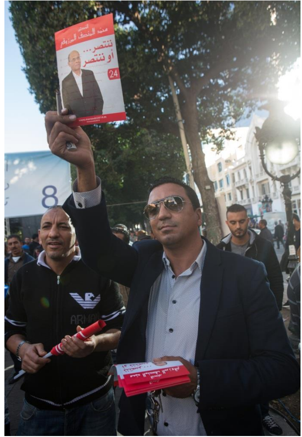
أحد مؤيدي الرئيس المؤقت لتونس و المرشح الرئاسي منصف المرزوقي حاملاً صورة لمرشحه في شوارع تونس في اليوم الأخير من الحملة الانتخابية للإنتخابات الرئاسية.

ويحدد القانون الانتخابي مهلة ب 45 يوما من تاريخ إعلان النتائج النهائية للمرشحين لتقديم تقارير تمويل