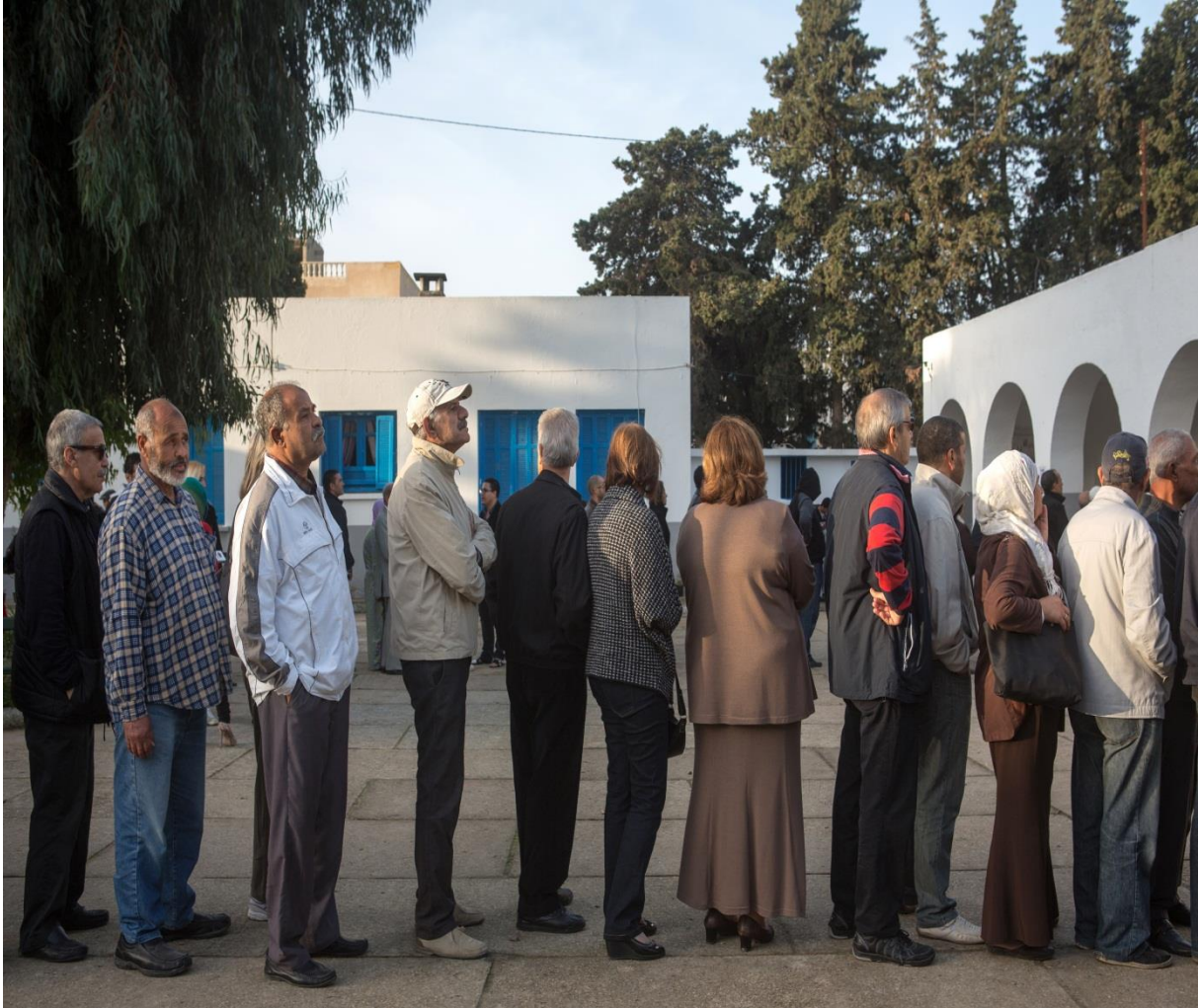
الناخبون التونسيون يشكلون طابوراً خارج مدرسة ابتدائية التي كانت بمثابة مكتب اقتراع خلال الإنتخابات الرئاسية في تونس يوم 23 نوفمبر 2014