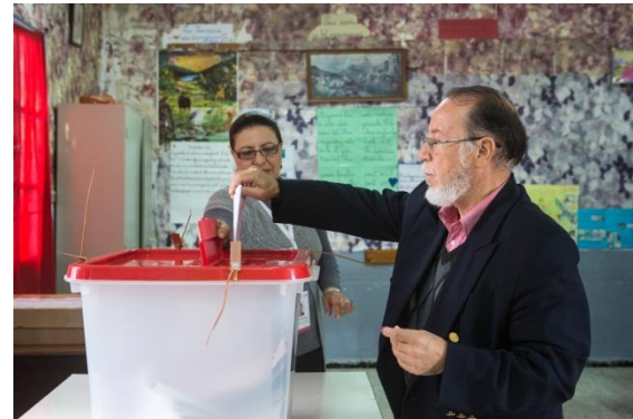
في معظم الأحيان أظهر الناخبون التونسيون فهما سليما لكيفية الإدلاء بأصواتهم.

تزامنت حملات التوعية التي قامت بها الهيئة العليا المستقلة للانتخابات خلال الانتخابات الثلاثة مع فترة الحملة الانتخابية الرسمية. فوضعت مجموعة واحدة من المواد الإعلامية، تتألف من ملصقات و لوحات و إعلانات في الصحف و ومضات إخبارية تلفزيونية تتكيف مع كل موعد ونوع جديد من الانتخابات. وركزت الرسائل على أهمية التصويت فضلا عن الجوانب التقنية للعملية، بما في ذلك شرح كيفية العثور على مركز الاقتراع وإجراءات التصويت. كما استخدمت الهيئة أيضا الشبكات الاجتماعية باعتبارها وسيلة للتواصل مع الجمهور. بالإضافة إلى ذلك، نشرت إدارة الانتخابات فرقا متنقلة من موظفي تثقيف الناخبين في بعض الأجزاء من البلاد. و قامت هذه الفرق بمحاكاة إجراءات التصويت مع الناخبين. و رغم أنّ الهيئة العليا دعت منظمات المجتمع المدني لتنسيق رسائلها، إلا أنها قررت عدم الإشتراك معها في حملات الحثّ على التصويت خوفا من أن ينظر إليها على أنها تساهم في التأثير على خيار الناخبين. ونتيجة لذلك، كان التعاون بين منظمات المجتمع المدني والسلطات الانتخابية أقل بكثير من ذلك الذي كان موجودا في فترة تسجيل الناخبين كما تراجع عدد المبادرات التي تستهدف مجموعات محددة من الناخبين، مثل الشباب و النساء.