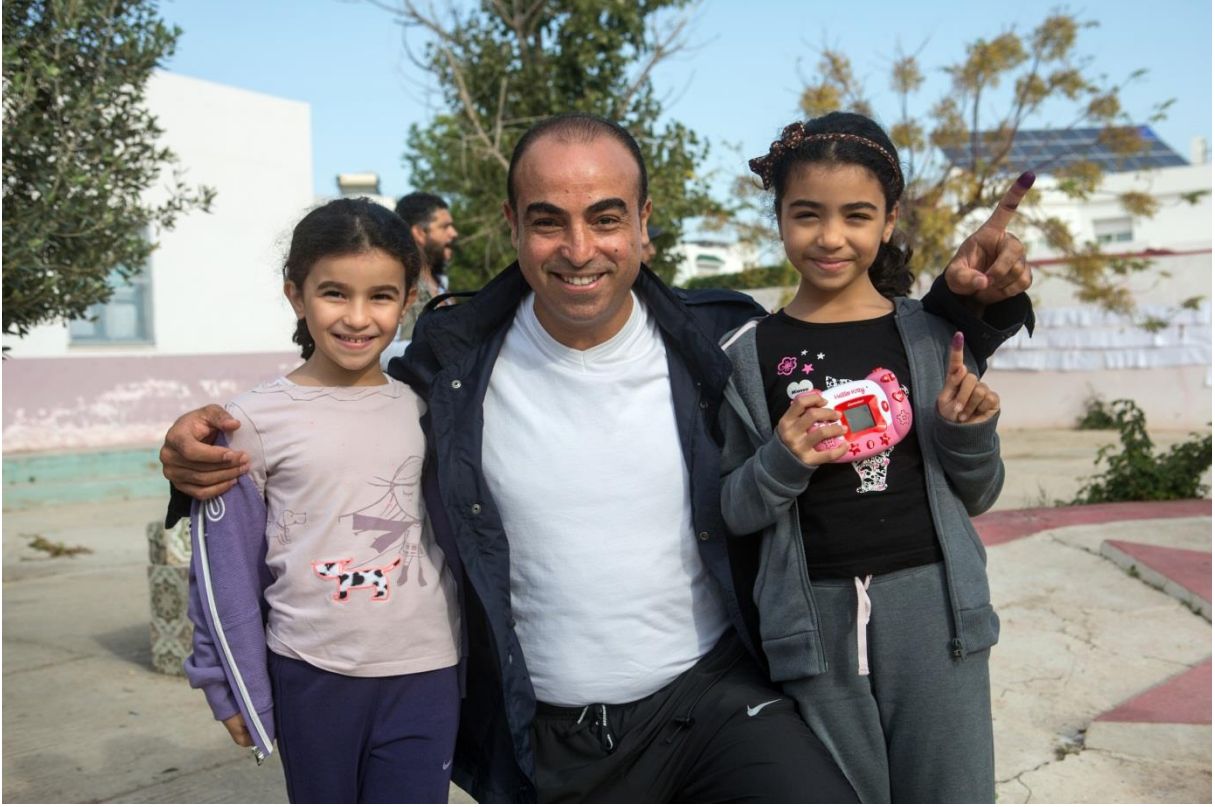
تونسى يعرض إصبغه بالحبر بعد أن قام بالتصويت في تونس يوم 23 نوفمبر 2014

مقعد ثالث. لكن المحكمة ألغت قرار الهيئة العليا، مستندة إلى الفصل 143 التي لا تنصّ على الإلغاء الجزئي للنتائج.